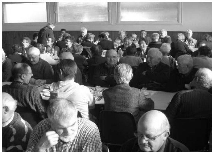
POT AU FEU - 5 Février 2015

- Jeudi 21 Mai : Sortie d'une journée dans les Alpes Mancelles. Visite guidée de St Céneri-le-Gérei, classé parmi les plus beaux villages de France. Déjeuner au restaurant. Promenade sur le lac de Sillé-le-Guillaume et découverte du lac en petit train. Inscription avant le 15 Avril (61 €)